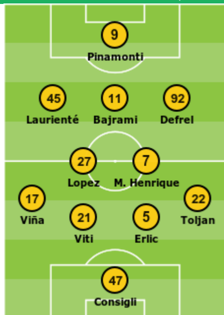
Cosenza - Sassuolo (13/08/2023 2-5)

Sostituzioni: 65. Ruan Tressoldi Per Viti, 66. Mulattieri Per Bajrami, 84. Volpato Per Pinamonti; Ceïde Per Laurienté, 96. Missori Per Viña, 107. Boloca Per Lopez