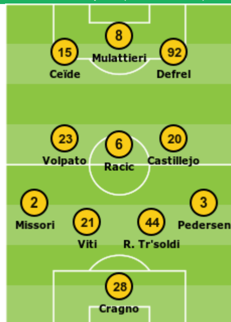
Sassuolo - Spezia (02/11/2023 0-0)

Sostituzioni: 67. Thorstvedt Per Volpato; Laurienté Per Ceïde, 76. Berardi Per Castillejo; Bajrami Per Defrel, 90. Lipani Per Racic, 99. Pinamonti Per Mulattieri